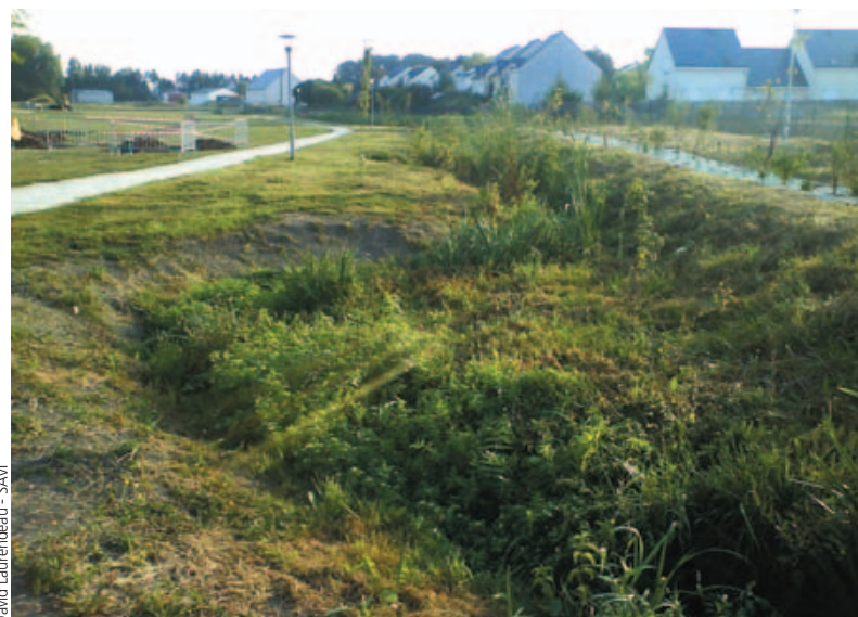
Le Mardereau en avril 2009, après les travaux de restauration.