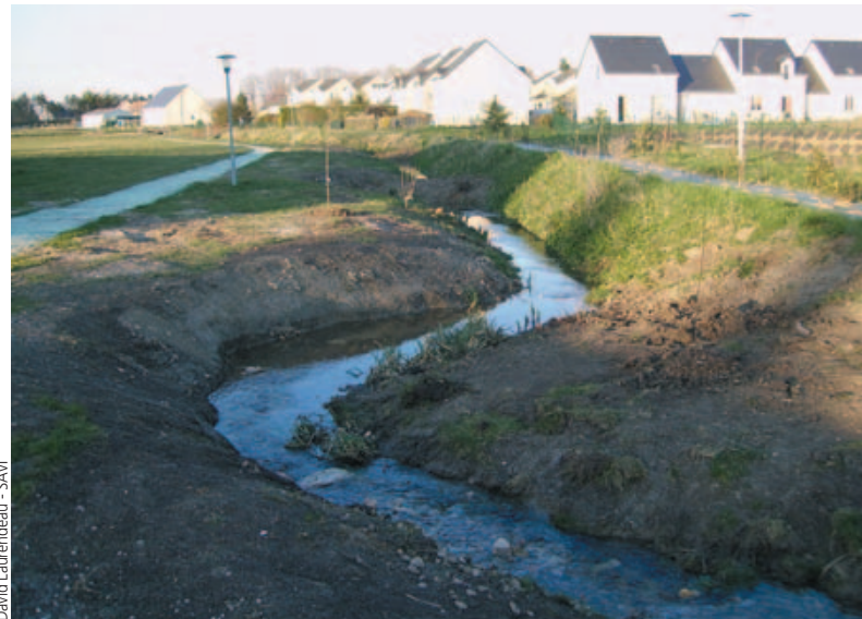
Le Mardereau avant restauration, en janvier 2009.