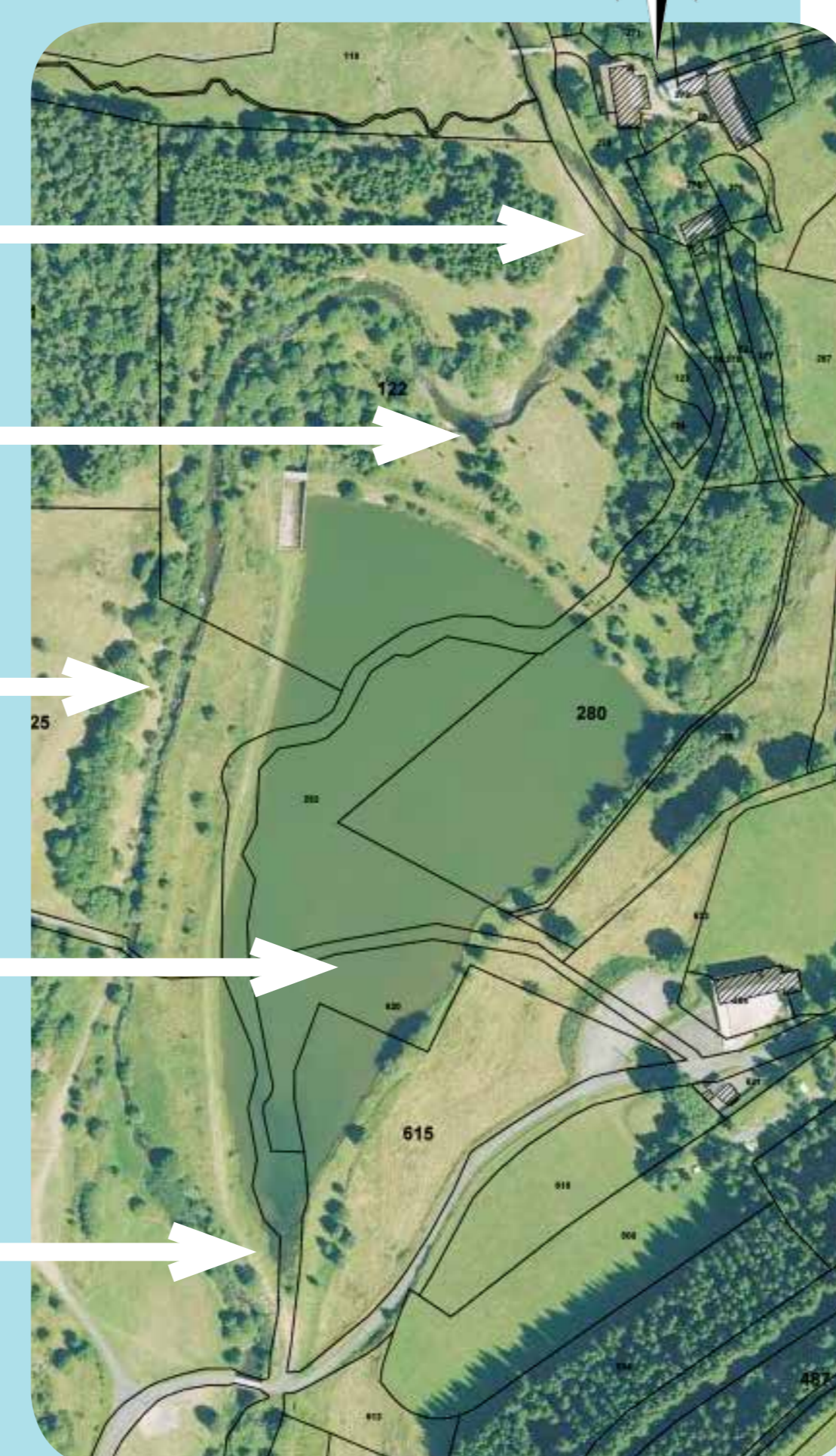
Création du plan d'eau sur le Lignon (photo aérienne 2014 et superposition du cadastre)

Perte de l'usage baignade, activité pêche et cheminement limités