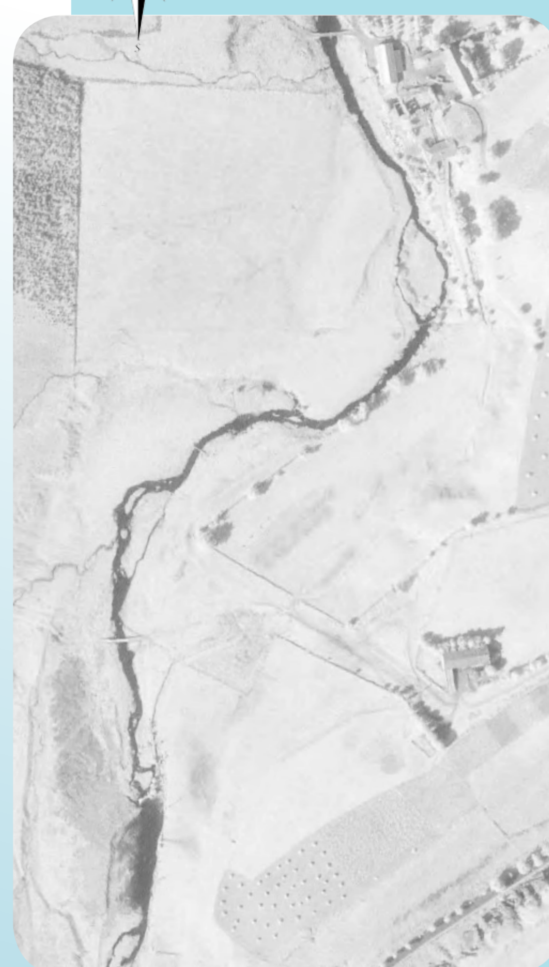
Lit historique du Lignon (photo aérienne 1963)

Atterrissement accentuant le risque d'inondation